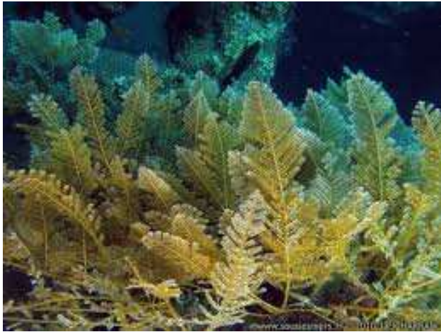
Plumes = Hydraire