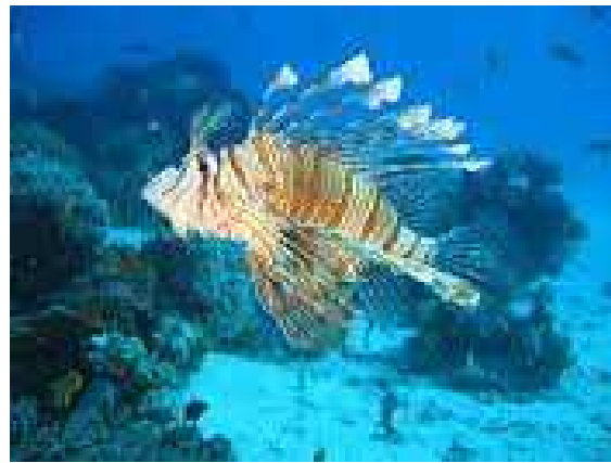
Rascasse = Poisson lion