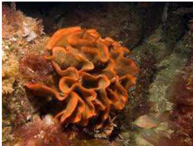
Rose des mers