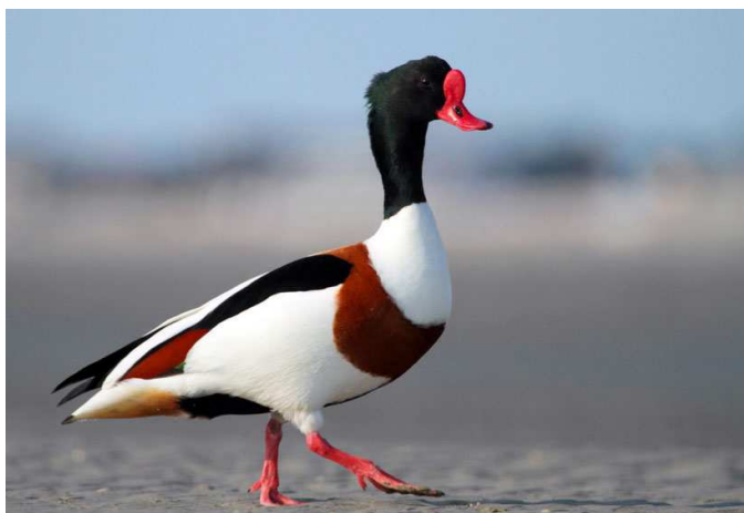
Tadorne de Belon