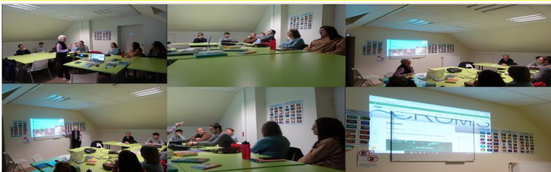
SOIREE BIO SCY DU 08/02/24